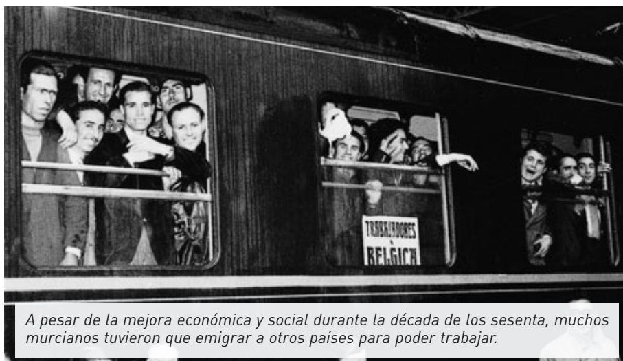
A pesar de la mejora económica y social durante la década de los sesenta, muchos murcianos tuvieron que emigrar a otros países para poder trabajar.